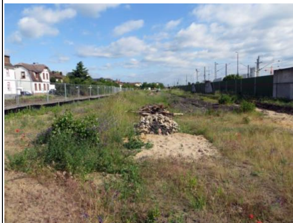
Abb. 4 b: Ruderalfläche mit den temporären Ersatzhabitaten, welche zum Ausgleich für die vorzeitig durchgeführten Maßnahmen 2015 aufgebaut wurden.

Die sandig-kiesigen Ruderalflächen nehmen den größten Teil der Untersuchungsfläche ein. Die Bestände werden überwiegend von mehrjährigen, warme und trockene Wuchsorte bevorzugenden Arten aufgebaut. Sie sind oft lückig ausgebildet und blütenreich. Nachtkerze und Königskerze dominieren in lückigen offenen Bereichen. Sukzessionsbedingt werden die Flächen teilweise von Hängebirke, Brombeere, Hartriegel, Hundsrose u. a. bewachsen.