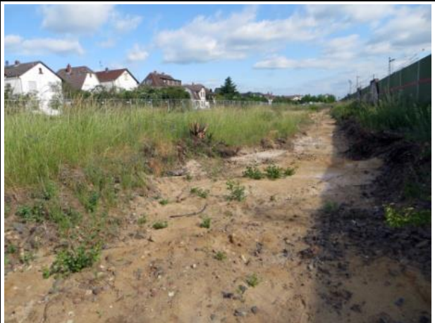
Abb. 6 a: Schotterflächen entlang der ehemaligen Gleise 2014.