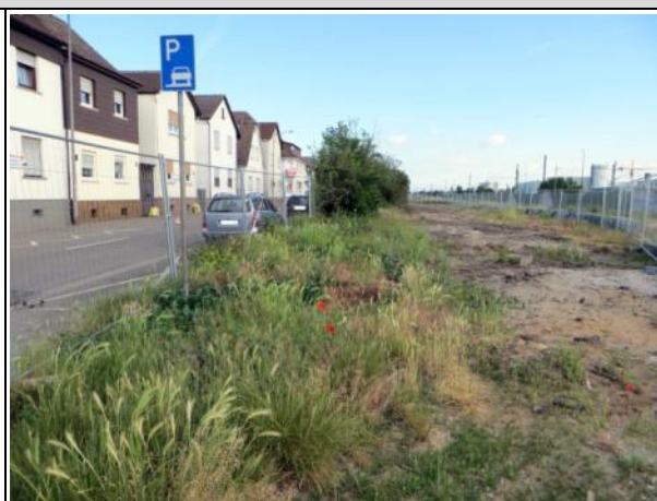
Abb. 3 b: Heckenstreifen Eugen-Schreiber-Straße 2015.

Funktion: Deckungsraum und Nahrungshabitat. Brutplatz von Mönchsgrasmücke, Singdrossel, Grünfink, Amsel, Zilpzalp, Klappergrasmücke, Stieglitz.