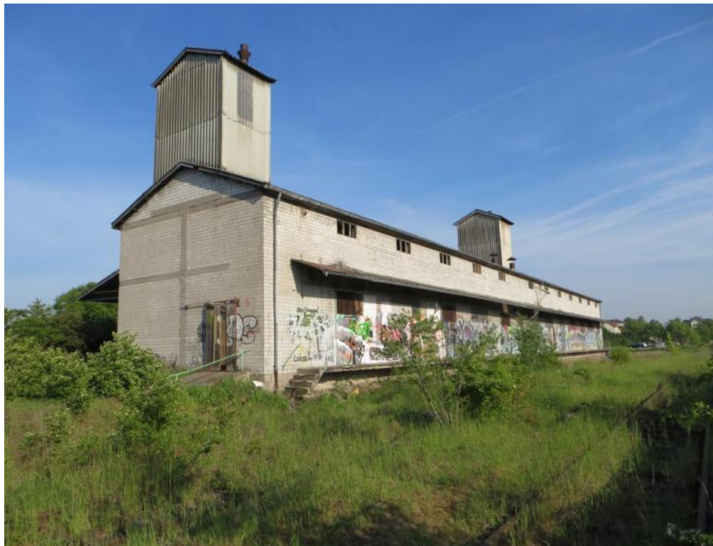
Foto 4: Die abzureißende Halle von Süden nach Norden fotografiert.