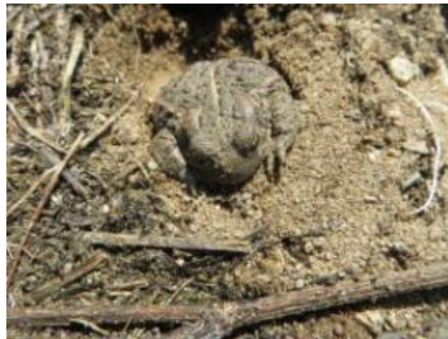
Abb. 9 und 10: Zauneidechse und Kreuzkröte im Untersuchungsgebiet 2014.

Beide Arten gelten als streng geschützt gemäß Anhang IV FFH-RL, die Kreuzkröte wird in Hessen in der Roten Liste als „Gefährdet“ eingestuft (Tab 3).