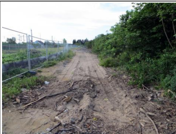
Abb. 5 b: Kopfsteinpflasterweg 2015

Hierbei handelt es sich um Erschließungsweg zur ehemaligen Lagerhalle. Auf den Asphaltflächen ist flächig Müll abgelegt. Der Kopfsteinpflasterweg wurde abgebrochen und die Pflastersteine aufgeschichtet und zum Abtragen bereitgestellt.