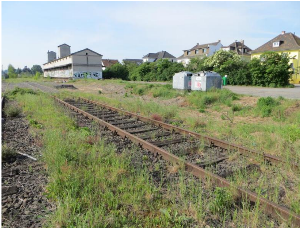
Foto 5: Die abzureißende Halle von Norden nach Süden fotografiert.