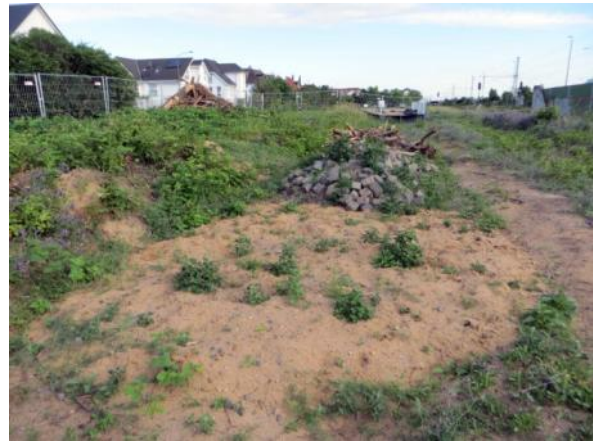
Abb. 2b: Gebüchsukzession mit artenarmem Brombeerbestand 2015.

Die Sukzession ist hier bereits fortgeschritten. Gebiet zwischen der Lärmschutzwand im östlichen Teil und den Gleisen. Wird jährlich gemäht, teilweise werden die aufkommenden Gehölze entfernt. Unter dem Hartriegel befinden sich höhere einzelne Hängebirke und Waldkiefer. Dazu überwiegend mit Brombeeren bewachsene Flächen.