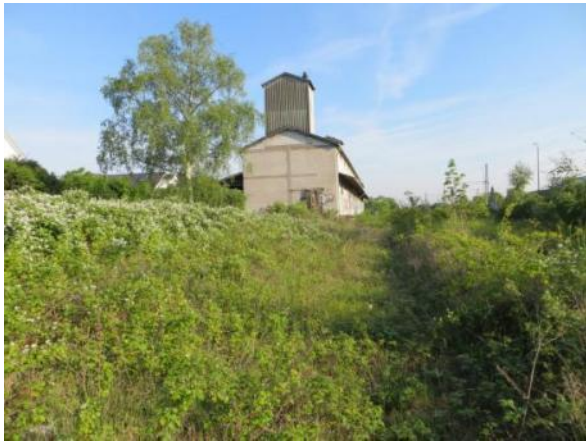
Abb. 2a: Gebüchsukzession mit artenarmem Brombeerbestand 2014.

Lokalität 1: Gebüchsukzession. Artenarme Gehölzsukzession mit Brombeerengestrüpp KV-Code: 02.110 KV-Wertpunkte: 36 Flächengröße: 0,0504 FFH: LRT: nein HB-Code: nein Empfindlich gegenüber: Schadstoffeinträgen, Veränderungen des Wasserhaushaltes