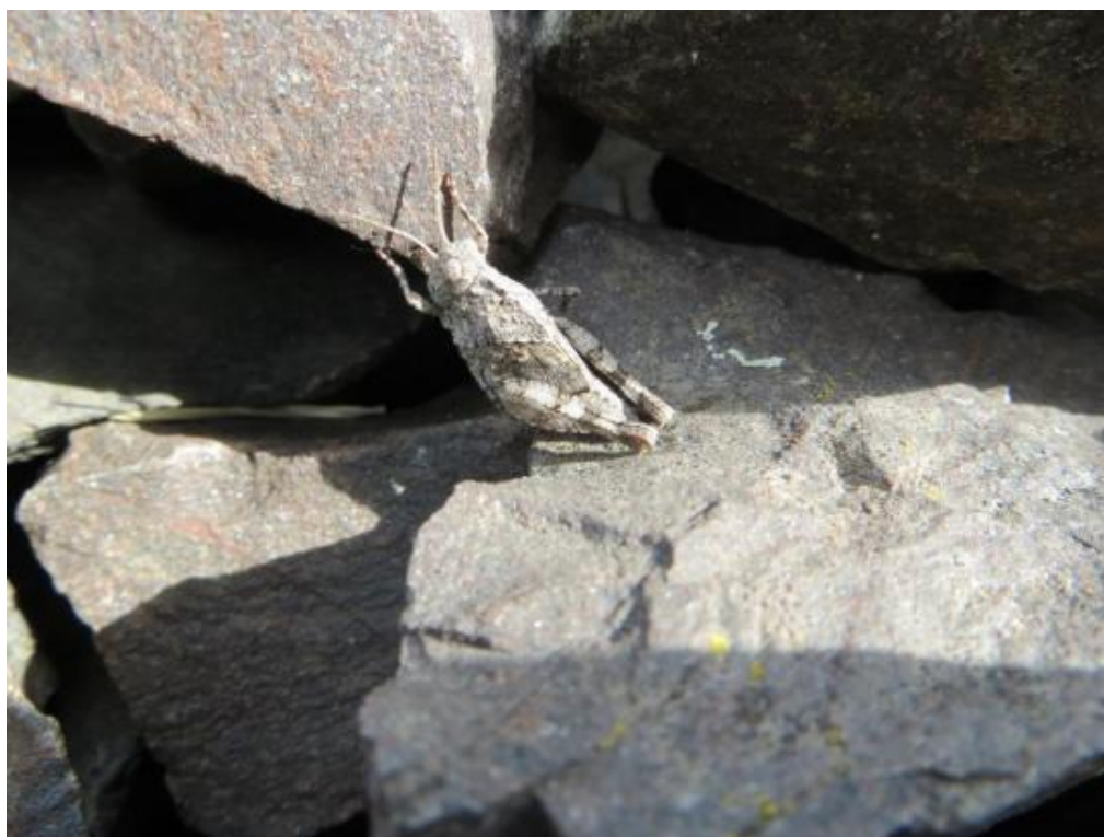
Abb. 8: Blauflügelige Ödlandschrecke in einem frühen Stadium.