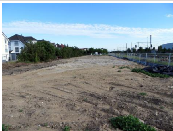
Abb. 7 b: Standort der ehemaligen Lagerhalle 2015.

Die überdachte ehemalige Lagerhalle ist bis unter das Dach offen und hat auf Grund der Massivbauweise nur wenige Nischen, die die Besiedelung für Eulen und Fledermäuse begünstigen. Darüber hinaus wird das Gebäude sowohl tagsüber als auch nachts regelmäßig von Menschen besucht. Diese häufigen Störungen dürften ebenfalls dazu beitragen, dass eine Besiedelung mit Fledermäusen und Eulen unwahrscheinlich ist.