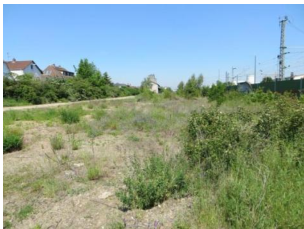
Abb. 4 a: Ruderalflächen 2014