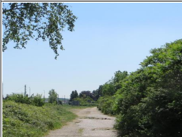
Abb. 5 a: Kopfsteinpflasterweg 2014

Hierbei handelt es sich um Erschließungsweg zur ehemaligen Lagerhalle. Auf den Asphaltflächen ist flächig Müll abgelegt. Der Kopfsteinpflasterweg wurde abgebrochen und die Pflastersteine aufgeschichtet und zum Abtragen bereitgestellt.