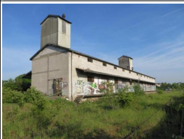
Abb. 7 a: Lagerhalle 2014