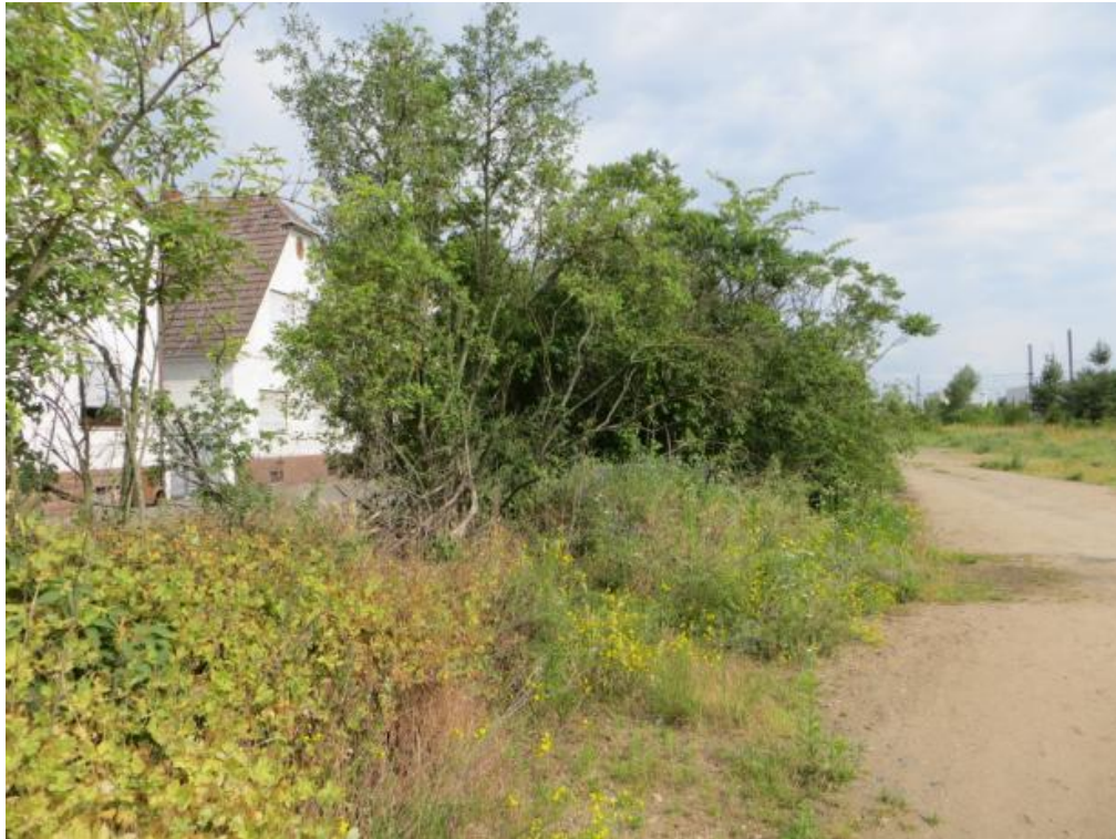
Foto 9: Deutlich sichtbar, aufgrund von Fremdeinwirkungen, gestörter Teil der Hecke.