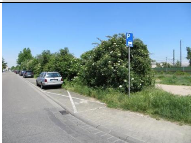
Abb. 3 a: Heckenstreifen Eugen-Schreiber-Straße 2014.

Der Grünstreifen zur Eugen-Schreiber-Straße wurde ursprünglich mit Ziergehölzen (Eschenahorn, Flieder, Gewöhnliche Schneebeere etc.) angelegt und wird inzwischen durch zahlreiche standorttypischen heimischen Gehölzen durchsetzt (wahrscheinlich natürliche Ansamung). Dieser Gehölzstreifen soll gemäß Bauplanung teilweise erhalten bleiben. An den Zufahrtswegen werden Gehölze entfernt. An verschiedenen Stellen wurde immer wieder Müll abgelagert.