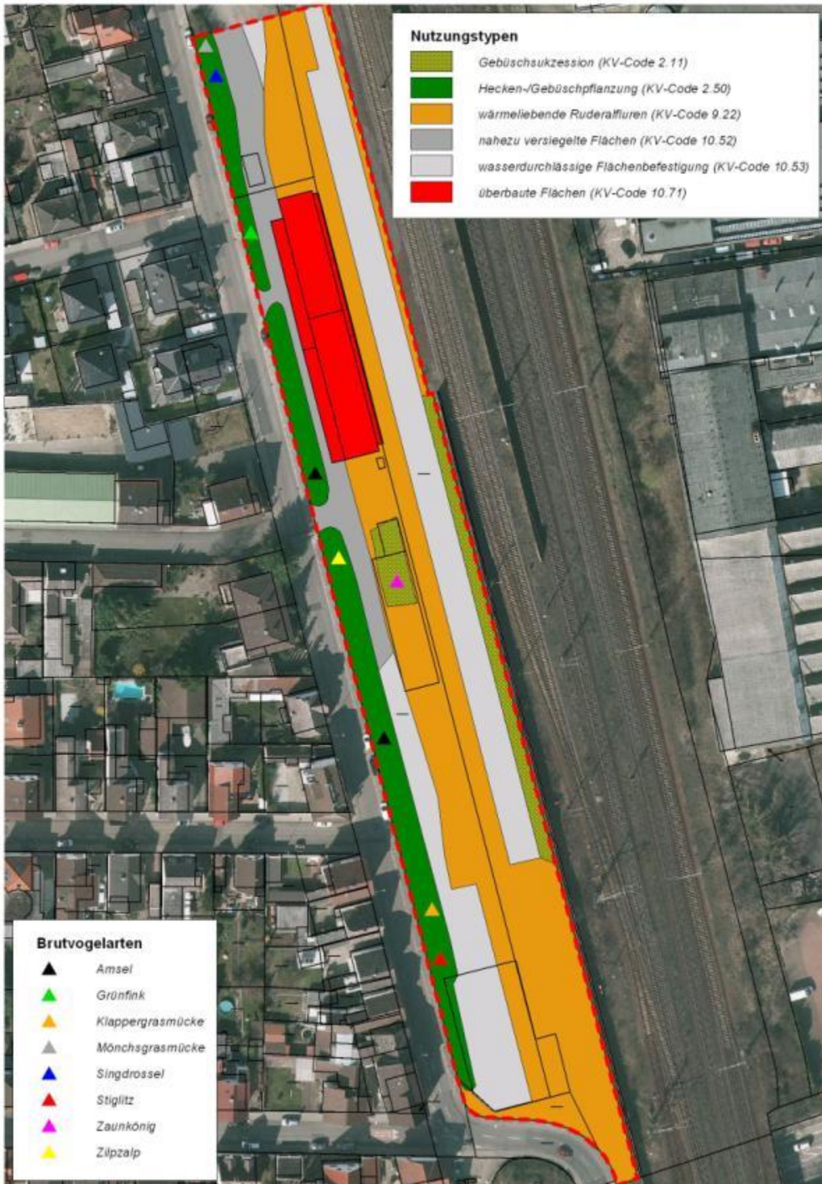
Abb. 11: Brutvögel im Untersuchungsgebiet 2014.