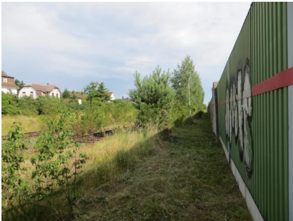
Foto 8: Grünstreifen entlang der Lärmschutzwand im abgemähten Zustand.