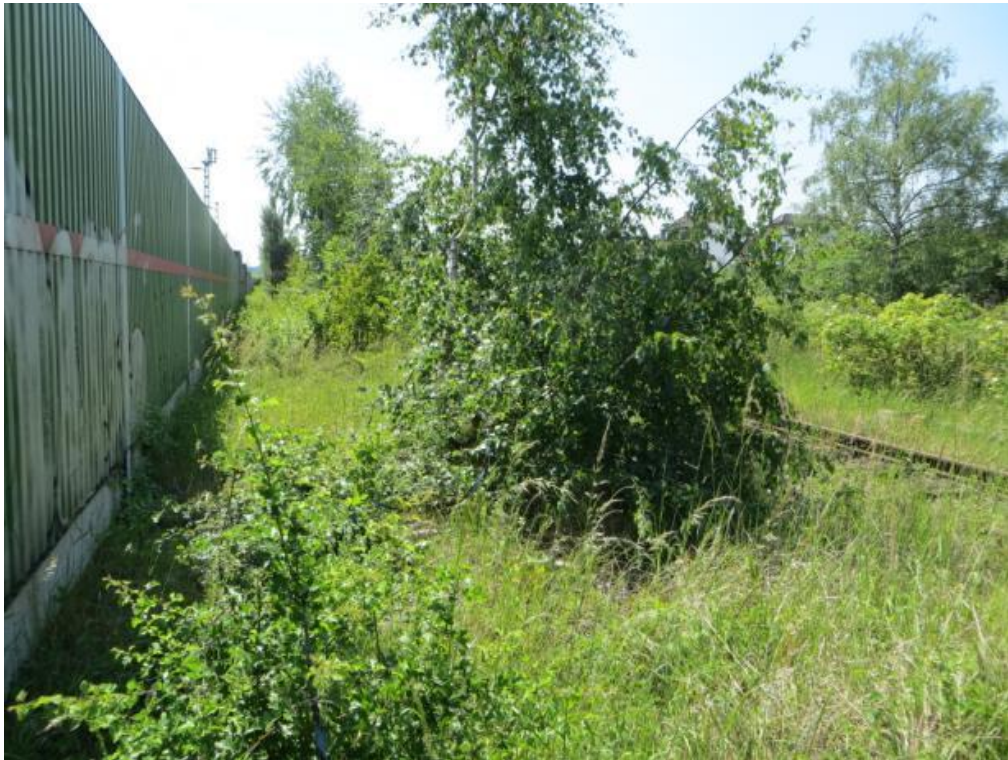
Foto 7: Grünstreifen entlang der Lärmschutzwand im ungemähten Zustand.