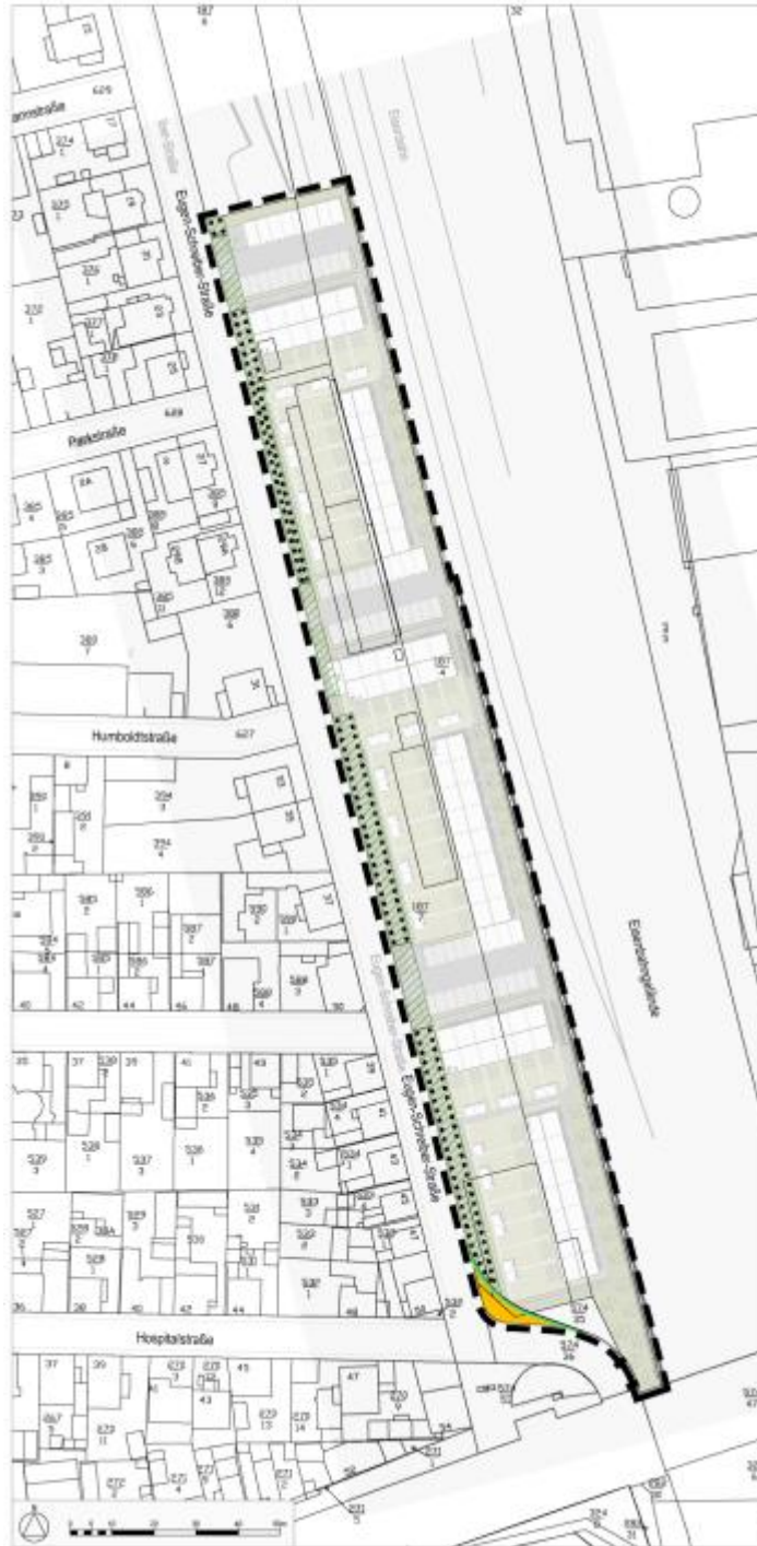
Abb. 1: Lampertheim, Kartengrundlage Stadtplanung+Architektur Fischer (2014).

Der zu untersuchende Bereich ist identisch mit dem Planungsgebiet (Abb. 1). Darüber hinaus wurden bei der Erfassung der Vogelarten und Reptilien die unmittelbar angrenzenden Randzonen mit berücksichtigt, da die Lebensräume dieser Artengruppen sich nicht auf solch kleine Teilareale beschränken.