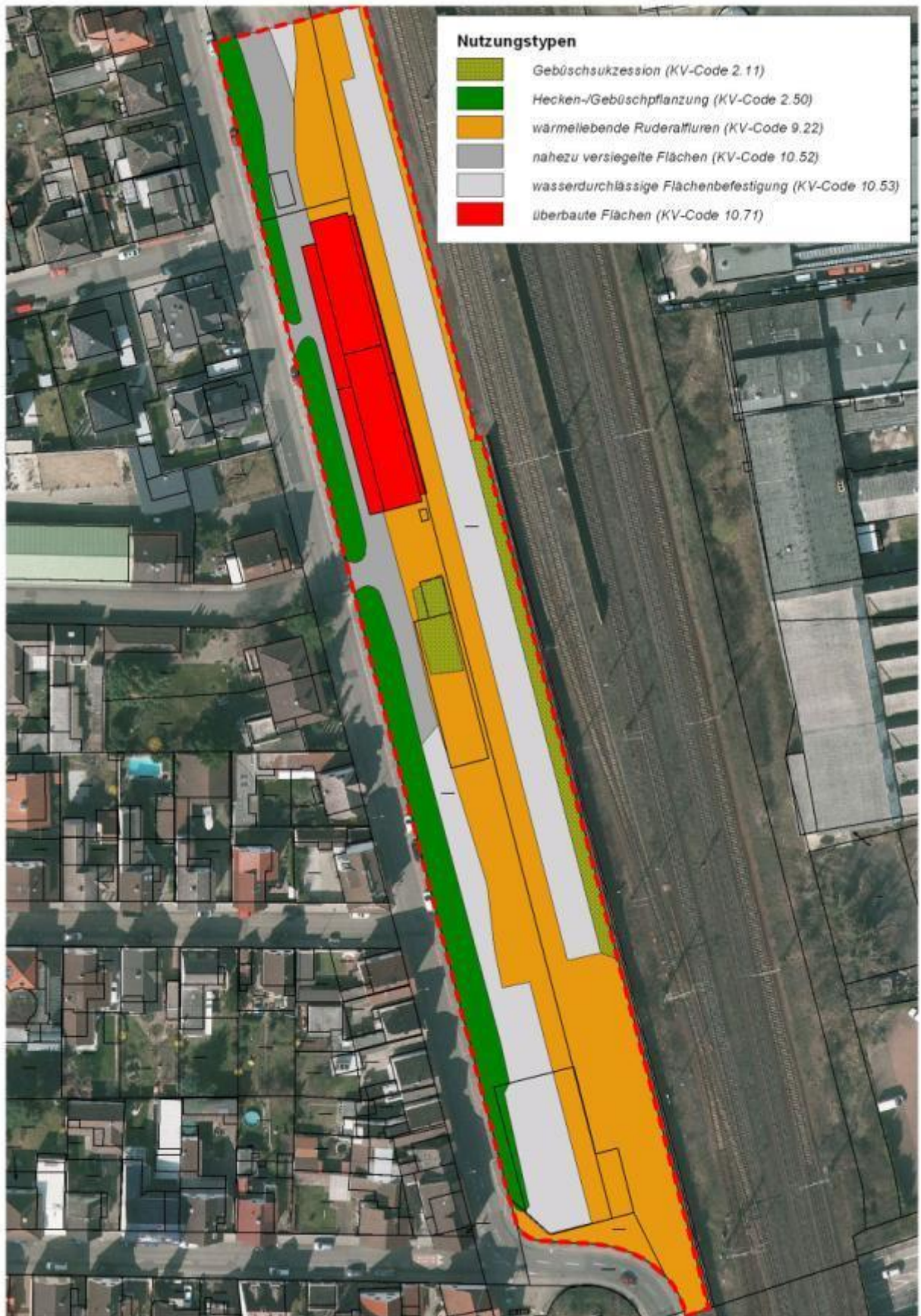
Abb. 2: Nutzungs- bzw. Biototypen im Untersuchungsgebiet 2014.